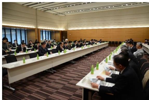
緊急ヒアリングを行った自民党石油流通議連

出席議員からは「被災したSS事業者の方々を今後どのように再建していくのか、SSの拠点のあり方をどうしていくのか、国としてしっかり考えていかなければならない」「災害時に備えた平時からの地元行政機関などとの連携が重要で、各都道府県で議員連盟を充実させていくべき」などの発言がされました。