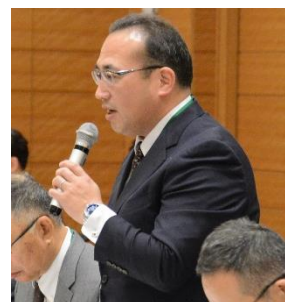
説明する中市副理事長