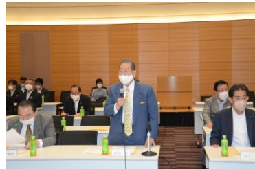
上は、衆議院議員会館で開かれた議連総会、左は、厳しい表情であいさつする野田会長