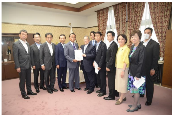
財務省で麻生財務大臣(中央)に要望書を手渡す野田会長ら